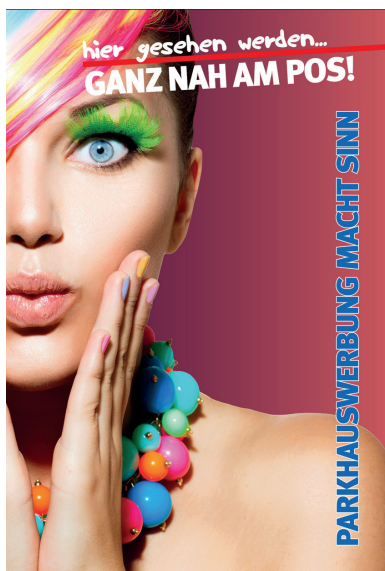
Werbeflächengröße: ca. 1.200 x 1.800 mm Werbeträger: City-Light (LED hintergrundbeleuchtet)

Die Gestaltung der Werbeflächen erfolgt in Abstimmung bzw. nach Vorgaben vom Kunden