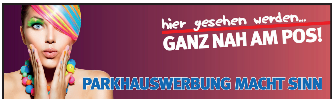
Werbeblächengröße: ca. 7.000 x 1.700 mm Werbeträger: Großposter-Spanntuch (angestrahlt)

Die Gestaltung der Werbeflächen erfolgt in Abstimmung bzw. nach Vorgaben vom Kunden