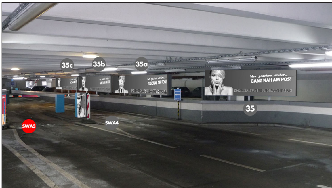
PH 2, Ausfahrt/Einfahrt, Schrankenbereich | Werbefläche SWA3 | Größe ca. 0,4 x 1,1 m und 2 mal 0,75 x 0,16 m