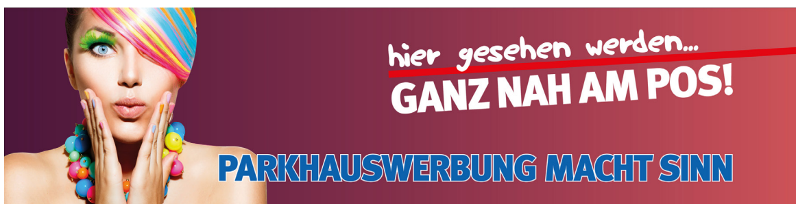
Werbeblächengröße: ca. 4.000 x 1.000 mm Werbeträger: Spanntuchtransparent (LED hintergrundbeleuchtet)

Die Gestaltung der Werbeflächen erfolgt in Abstimmung bzw. nach Vorgaben vom Kunden