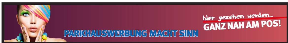
Werbeflächengröße: ca. 15.000 x 1.800 mm Werbeträger: Großposter-Spanntuch (angestrahlt)

Die Gestaltung der Werbeflächen erfolgt in Abstimmung bzw. nach Vorgaben vom Kunden