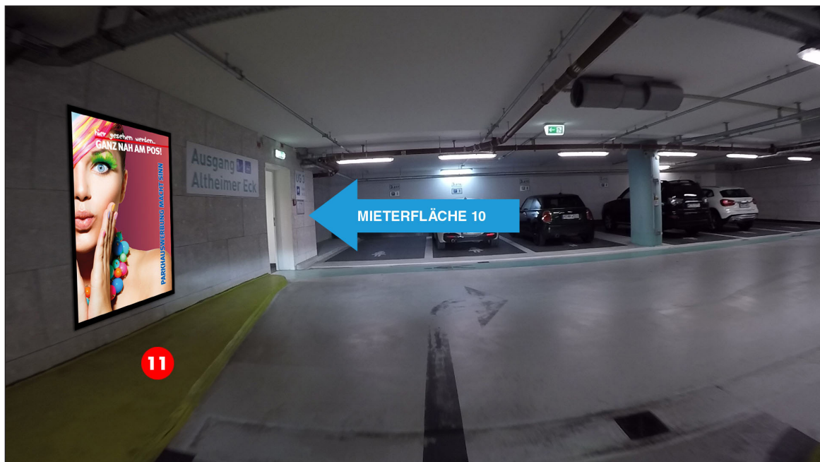
Zugang Aufzugsvorraum 3. UG | Werbefläche 11 | Größe ca. 1,2 x 1,8 m